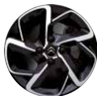
Lichtmetaal 16" Diamantée Two Tone HELLIX 205/55 R16V

● = Standaard ○ = Optioneel - = Niet leverbaar