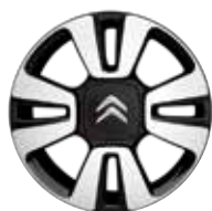
Lichtmetaal 16" Diamantée MATRIX 205/55 R16V