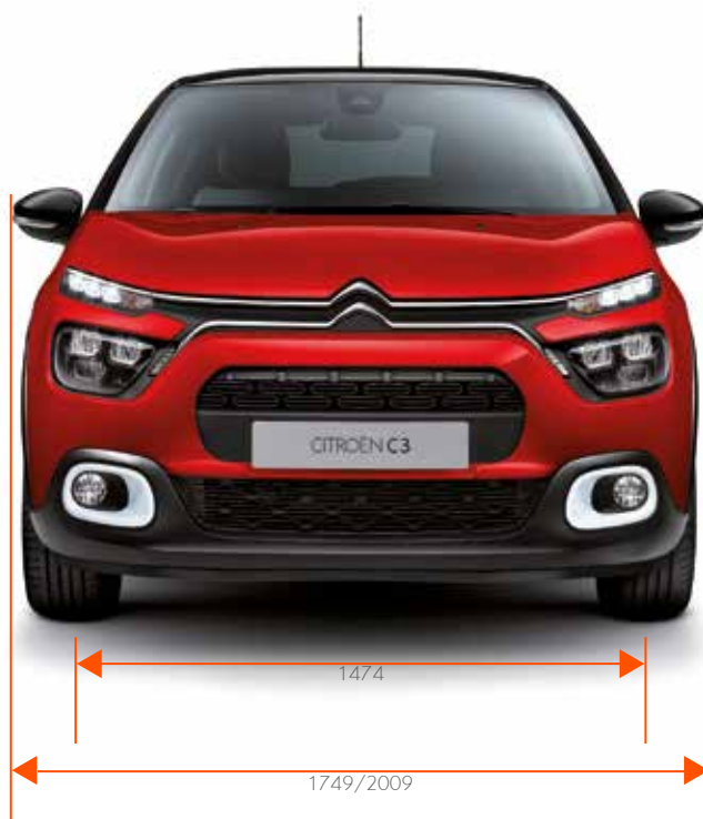
Breedte / Breedte met uitgeklapte buitenspiegels