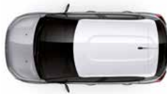
Two Tone Opal White