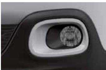
Pack Color Opal White