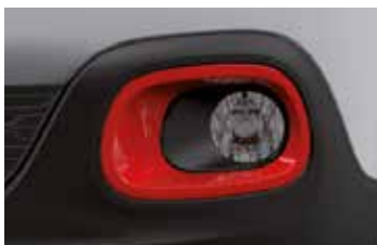
Pack Color Sport Red