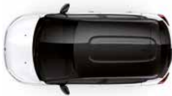
Two Tone Onyx Black