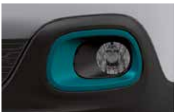
Pack Color Emerald