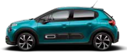
Spring Blue (parelmoer)