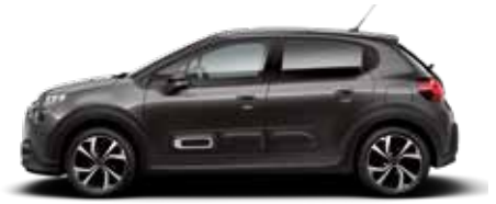
Platinum Grey (metallic)