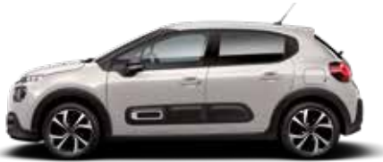
Soft Sand (parelmoer)