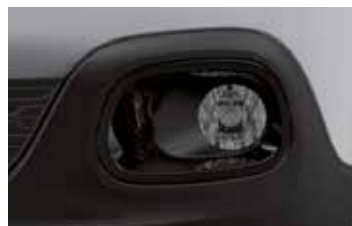
Pack Color Onyx Black