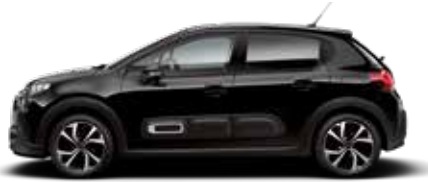
Perla Nera Black (parelmoer)