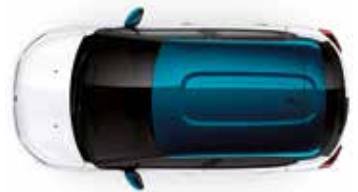
Two Tone Emerald