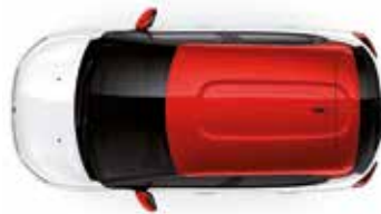
Two Tone Sport Red