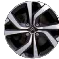
Lichtmetaal 17" Diamantée VECTOR 205/50 R17V

● = Standaard ○ = Optioneel - = Niet leverbaar