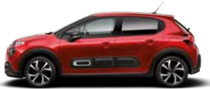
Elixer Red (parelmoer)