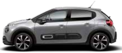
Steel Grey (metallic)