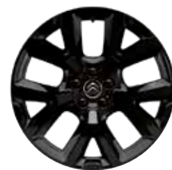
Lichtmetaal 19" ART Black 205/55 R19

● = Standaard ○ = Optioneel - = Niet leverbaar