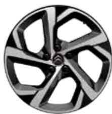
Lichtmetaal 18" SWIRL 225/55 R18