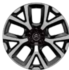
Lichtmetaal 19" ART 205/55 R19