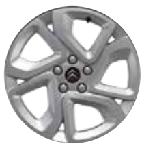
Lichtmetaal 17" ELLIPSE 215/65 R17